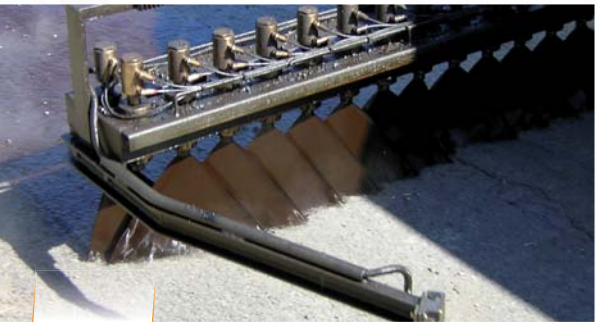
Calidad de riego óptima