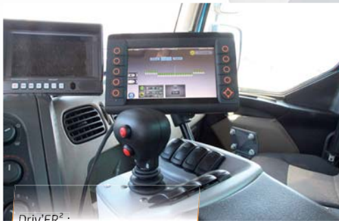
Driv'ER 2 : Funcionamiento automático / Seguimiento preciso de obra