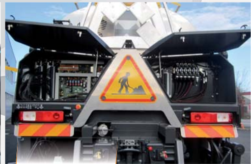
Seguridad reforzada / Mantenimiento fácil