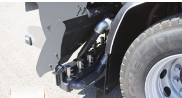
Un riego preciso