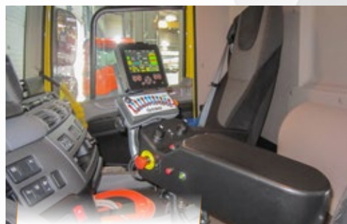
SMART16 : Funcionamiento automático con uso simple