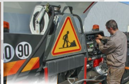
Seguridad reforzada / Mantenimiento fácil